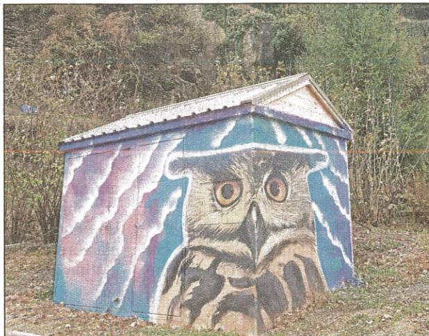
Un beau hibou surveille les touristes !

Valter Napolitano [notre photo], référent graffiti d'« Éveille ton art » vient de finir la maisonnette du village et se prépare à conti-