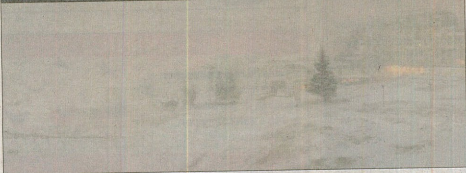
Isola 2000 avait revêtu, hier soir, ses habits d'hiver.