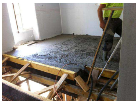
Vue de dessus