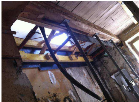
Vue de dessous